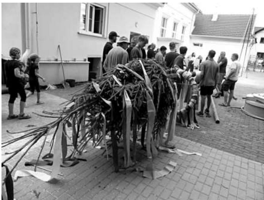
Páteční stavění máje

Začneme hezky od začátku, tedy od stavění máje. Bylo vidět, jak už to pánové mají v malíčku, mája byla nahoře ani ne za dvě minuty! A pro zvědavce – letos měla 21 metrů. Když už ale chlapcům nedalo velkou práci ji postavit, dalo jim alespoň práci ji potom uhlídat. V noci je totiž navštívilo pár záškodníků z okolních chas, kteří doufali, že si připíšíou na účet nějaký ten zářez na kmeni – nebojte, nepřipsali.