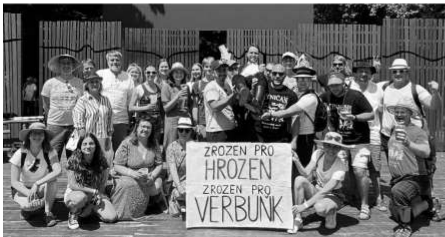
Knínický fanclub