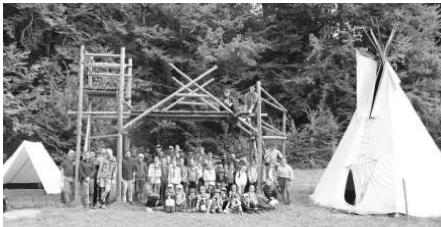
Skautský tábor 2025