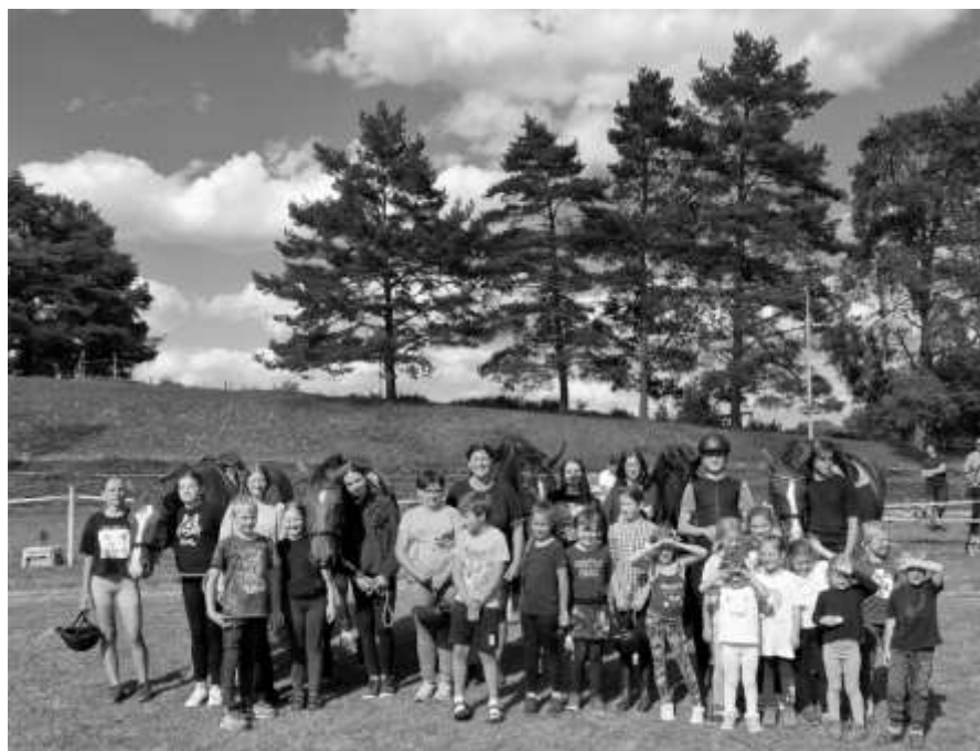
Účastníci příměstského tábora na střelnici