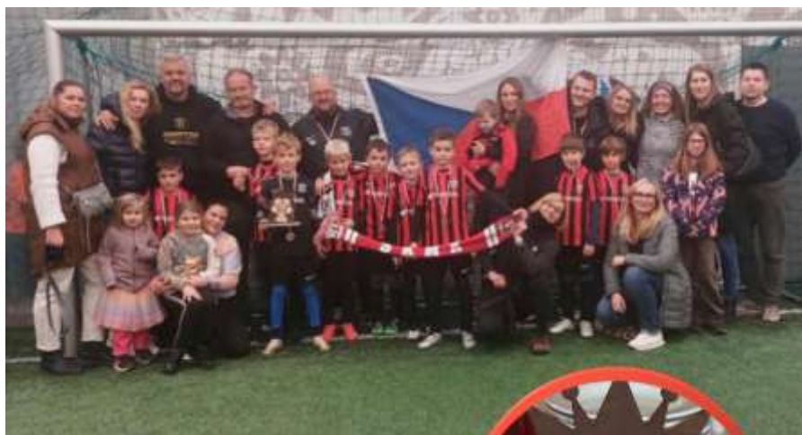
Fotky z turnaje v Polsku