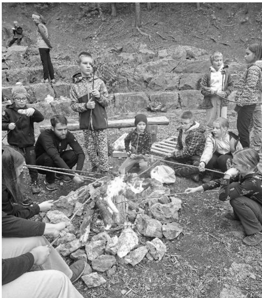
Skauti v čebínském lomu Na Kamínce