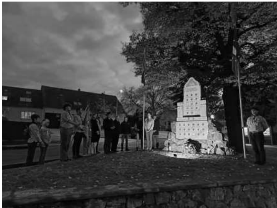
Pietní akt u památníku padlých v I. světové válce