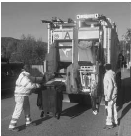
Nové svozové auto na tříděný odpad

Naopak velké kontejnery o objemu 1100 litrů, které se nacházejí u bytových domů nebo na veřejných stanovištích (eko dvorcích), nemohou být těmito vozidly obsluhovány. Tyto nádoby budou vyváženy samostatně, v odlišných termínech a jinými typy svozových vozů.