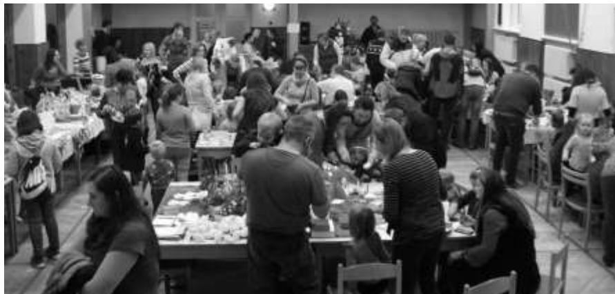
Jarmaření – adventní tvoření 2019