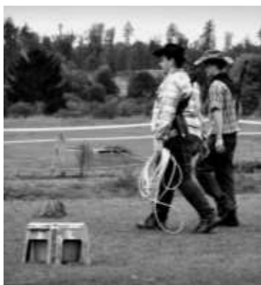
Banditi na střelnici

Poté se pokračovalo ve vožení dětí. Koně – čeští teplokrevníci se jmény Lindt (maskot stáje), Anita, Sarita, Elizabeth, kříženka Lady Di, American paint horse Wallery a fríský kůň Monty měli neustále spoustu zájemců. Část koní k nám přišla s pohnutým osudem, ať už se jednalo o nevhodné podmínky a zacházení, nebo zkrátka byli odloženi pro nepotřebnost. Náš nejstarší koník Roy letos oslavil úctyhodných 30 roků.