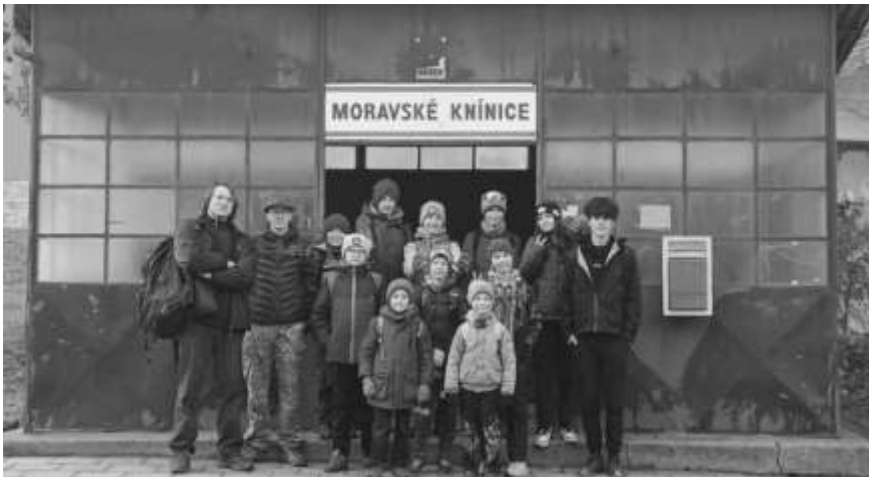
Začátek výpravy u autobusové zastávky