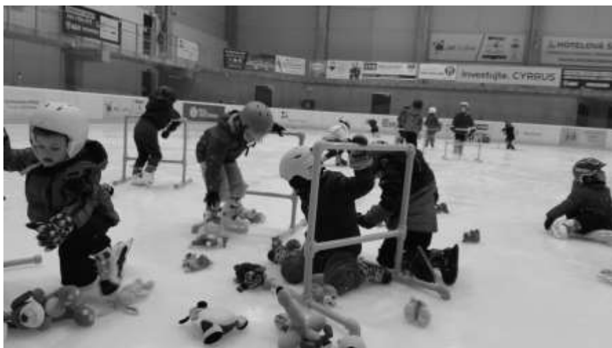
Děti na bruslích

Bc. Pavlína Kozinová – zástupce pro předškolní vzdělávání