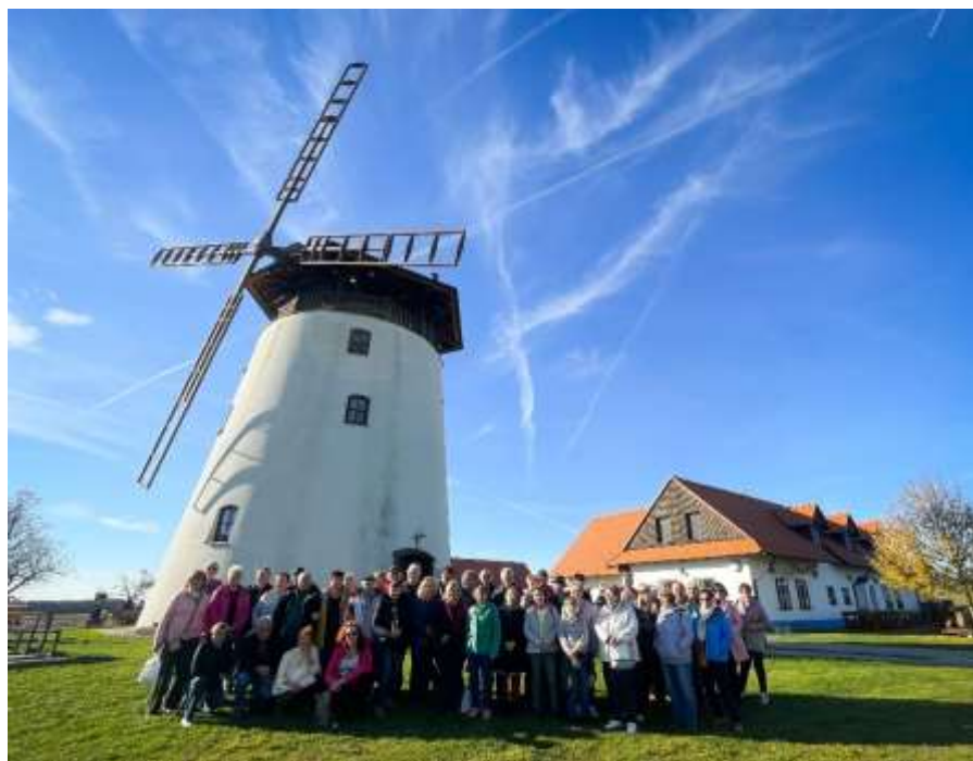
Senioři před Bukovanským mlýnem