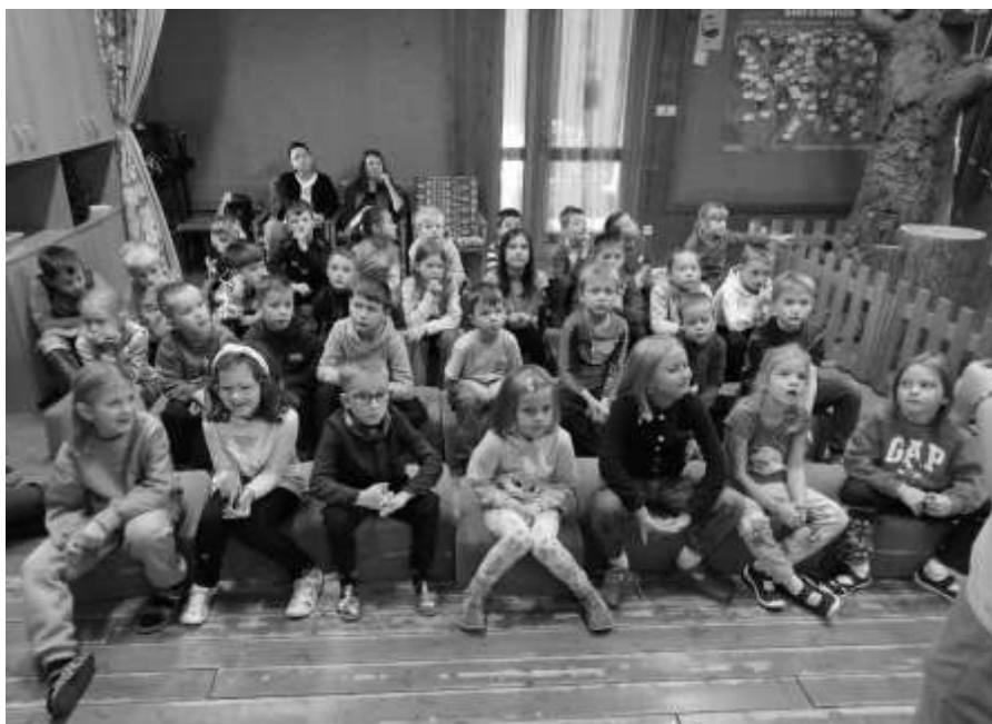
Žáci při výukovém programu v Soběšicích