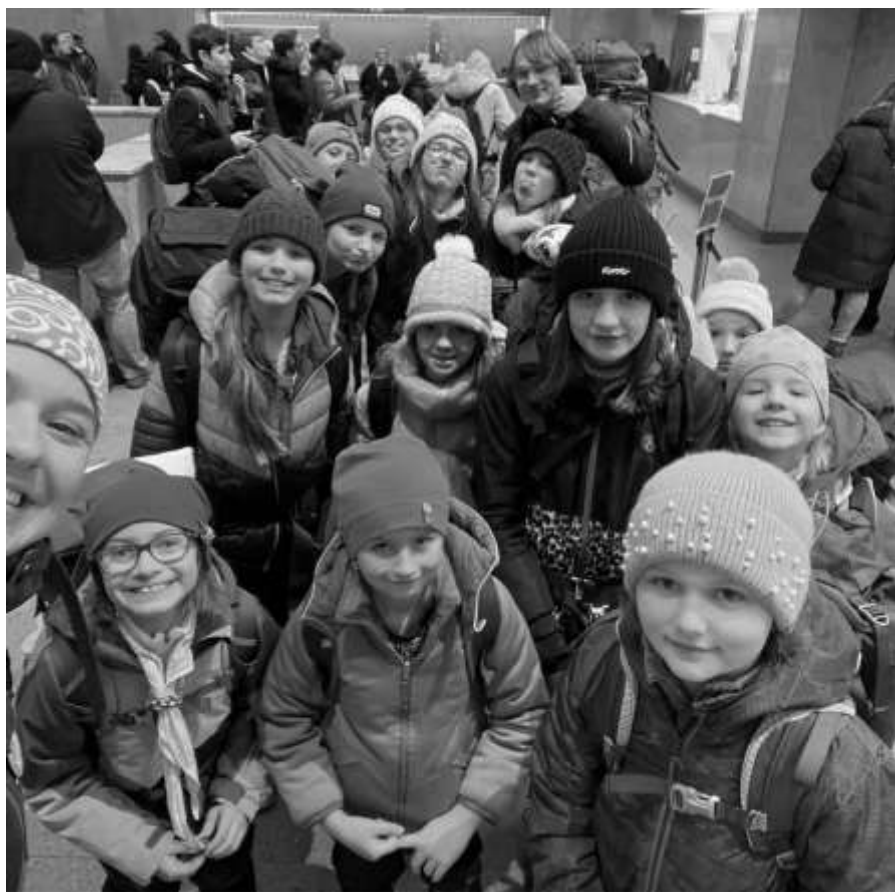
Skautky na výpravě