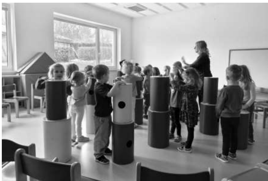
Děti a drumbeny

25. 11. 2025 měly děti i paní učitelky možnost relaxovat u programu Barevný les s drumbeny. Tento muzikoterapeutický program je environmentálně zaměřený, s procvičením rytmizace, písni, jemné i hrubé motoriky a barev v herní aktivitě (les, zvířátka). Každé dítě si mohlo vyzkoušet svůj bicí nástroj-drumben.