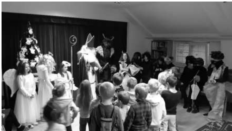
Mikuláš přišel i do školy