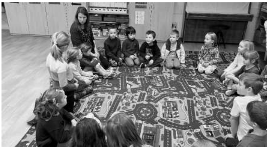
Kořátka ve škole