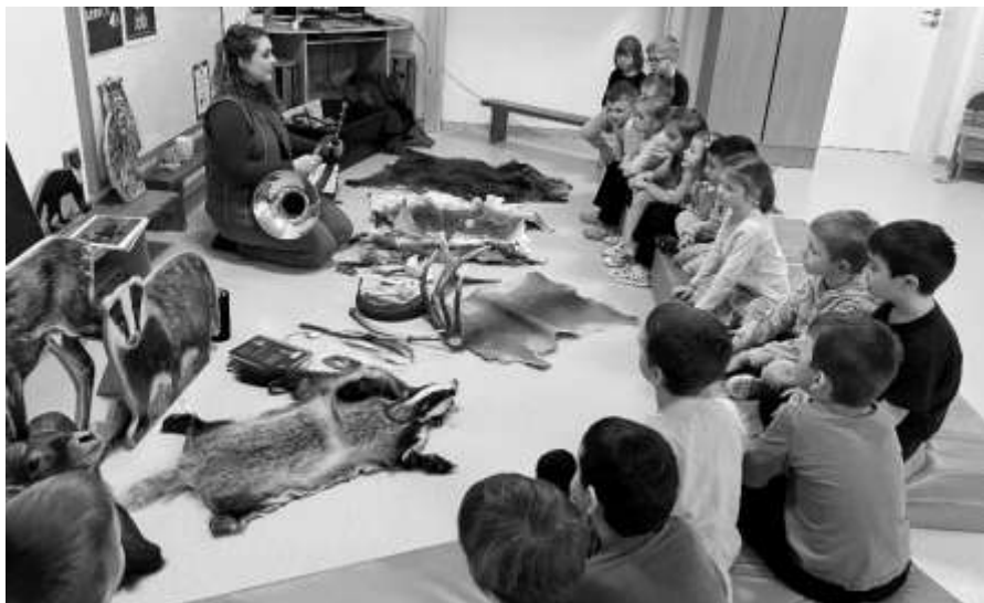
Vzdělávání s lesníky

dlouhodobou snahu zasít do dětí semínko sounáležitosti s přírodou a potřebu její ochrany a péče ze strany nás všech.