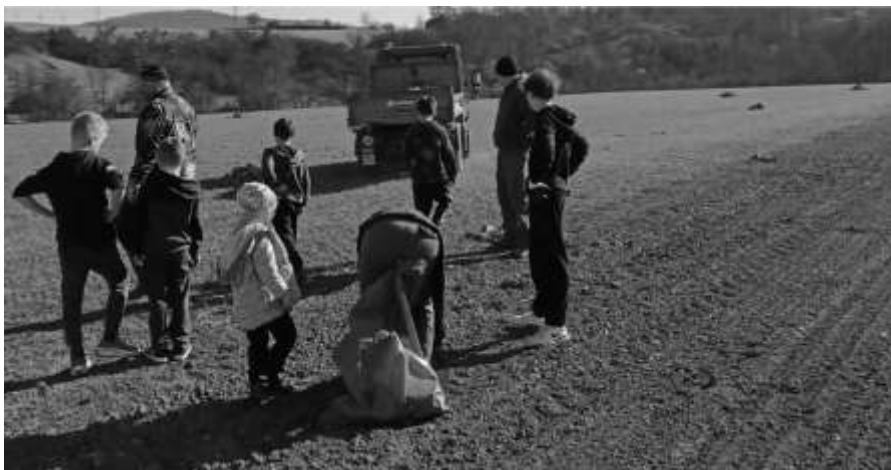
Rybáři s dětmi při sběru kamenů v poli

V sobotu 14.3. proběhla u rybníka Pod Kaplí jedna z brigád členů Sdružení knínických rybářů, které jsem se částečně osobně zúčastnil, jako řidič vozidla při sběru kamenů a odpadků na přilehlých polích, které zde byly navezeny při odbahňování rybníka. Při této akci se nasbíralo odhadem 5–6 t kamenů.