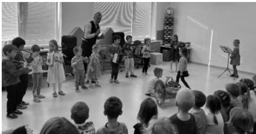
Orchestr v mateřské škole