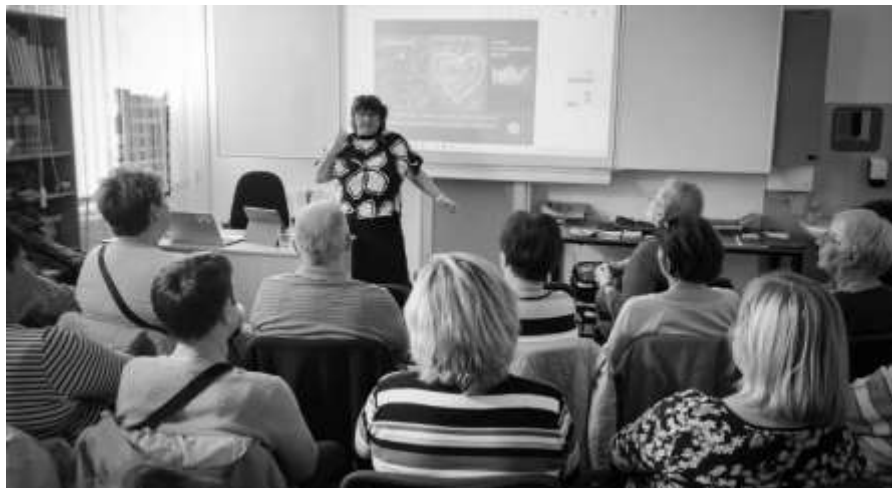
Přednáška o bezpečnosti v každodenním životě

Ve středu 18. března, v krásný, téměř jarní den, se v naší obci uskutečnila vzdělávací akce, určená především našim seniorům. Tématem bylo bezpečí v každodenním životě – od podvodů zaměřených na seniory, přes rizika v kyberprostoru až po bezpečné chování v oblasti bankovníctví.