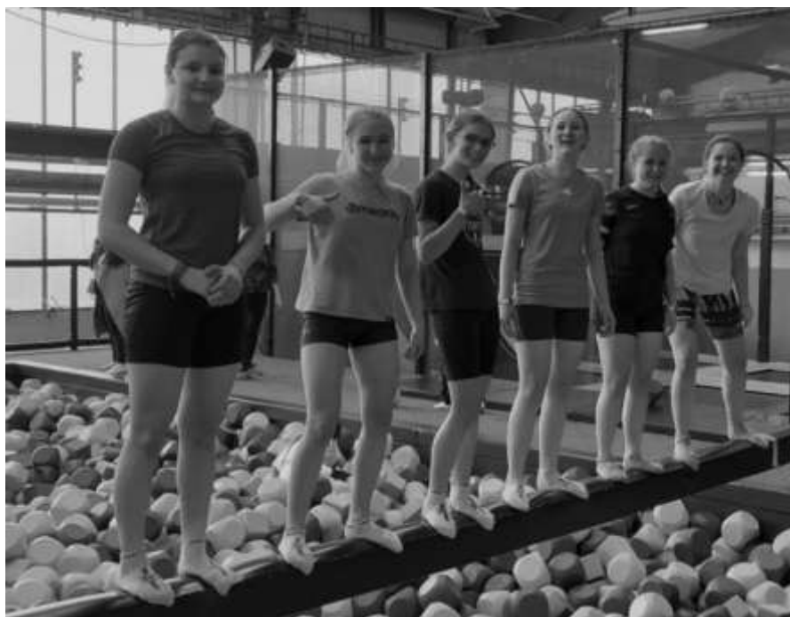
Kobry v jumpparku

Březen se stal měsícem mnoha družinových výprav. Například Kobry se pod vedením svých rádců vydaly do brněnského jumpparku a po návratu do Knínic se přesunuly na Polákovu chatu, kde si samy uvařily a měly společnou přespávačku.