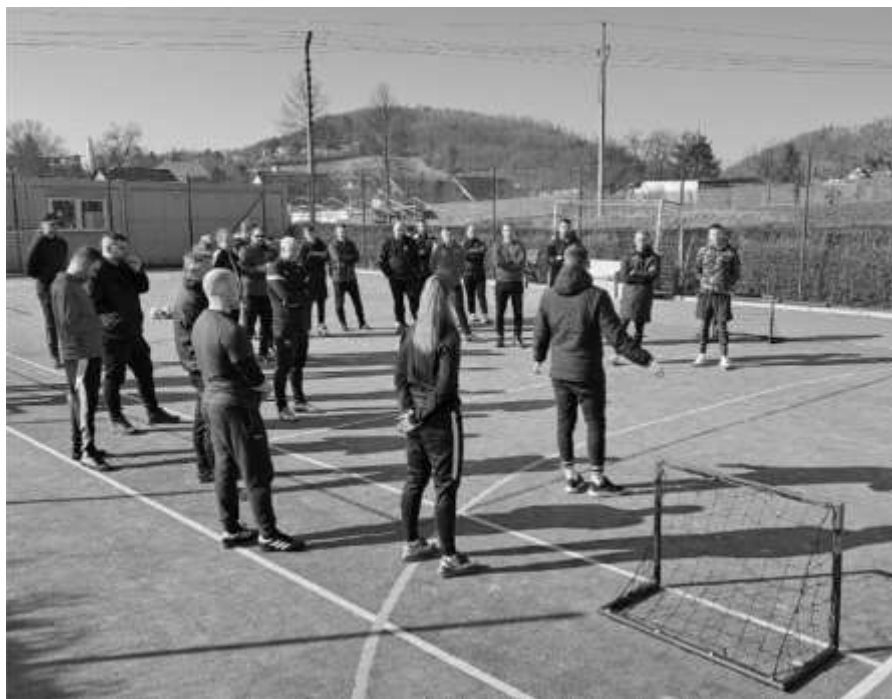
Trenéři při školení na víceúčelovém hřišti