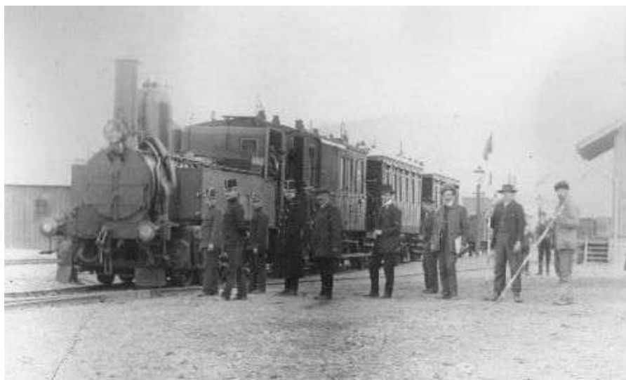
Historická fotografie vlaku na trati Kuřim – Veverská Bítýška