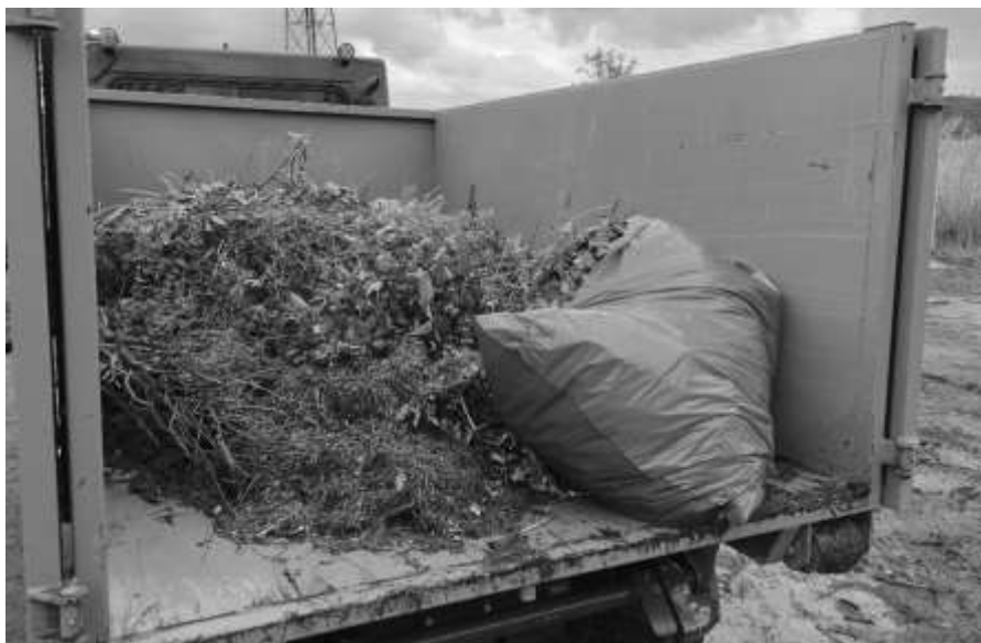
Igelitový pytel v kontejneru na bioodpad