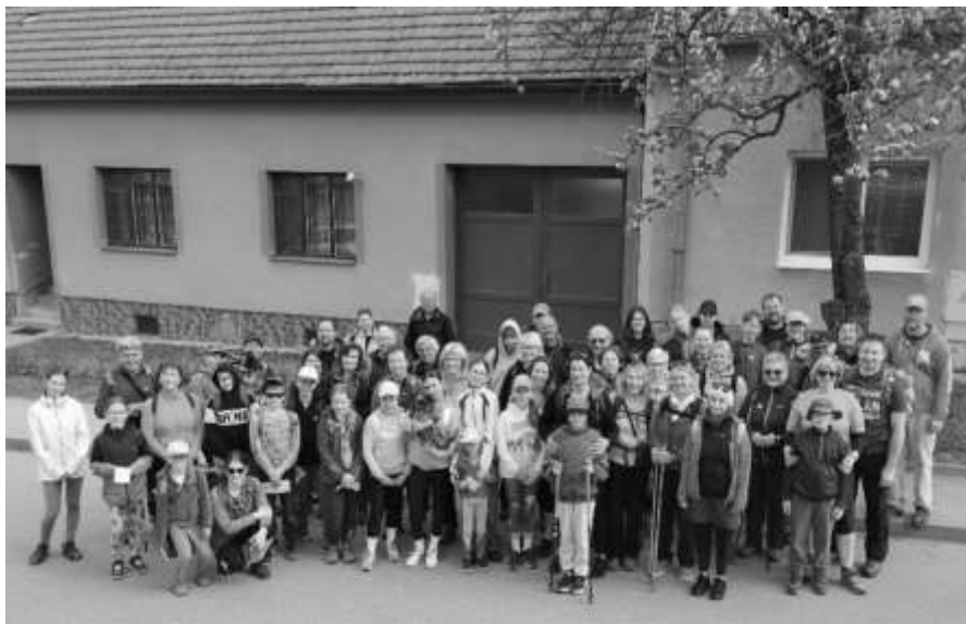
Účastníci pochodu Jdeme na chrousty na startu u obecního úřadu

Část turistů se ale od pomníku U Lva vydala směrem na „Sokolák“ a Osadu. Zde se také občerstvili v restauraci Princezna. Poté se vydali nad Rozdrojovice a dále na Trnůvku, pak kolem oborního plotu přes Senařov, k Zelenému stolu, okolo památníčku U Rumunů k myslivecké chatě a dále až do Knínického hostince, kde již čekala parádní country hudba pod taktovkou Františka Pekaře Kučery. Krásné počasí přispělo k pohodové patnácti, respektive devatenácti kilometrové procházce.