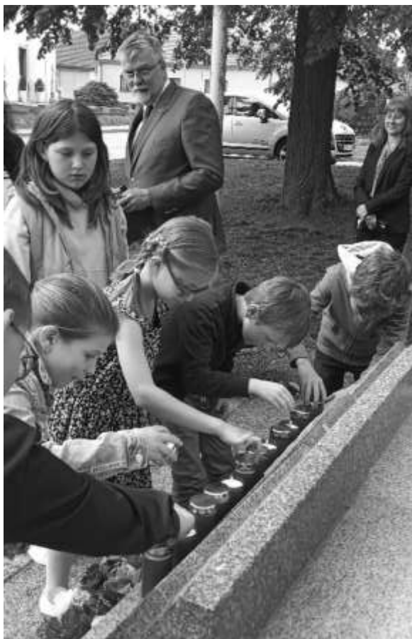
Žáci u památníku v Koutě

V sobotu 9. května 2026 odpoledne uplynulo 81 let ode dne, kdy byly osvobozeny Moravské Knínice od nacistické okupace.