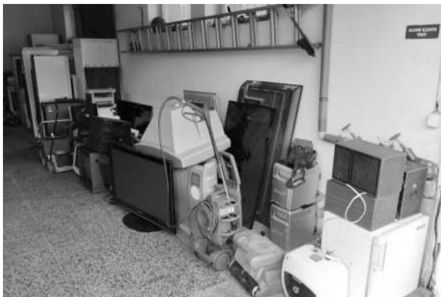
Shromážděný elektroodpad v garáži obecního úřadu

Poděkování patří chlapcům z chasy, kteří se brigádily zúčastnili.