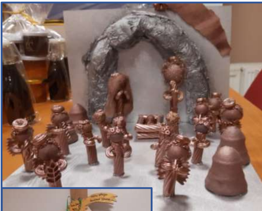
↑ Obr. 9