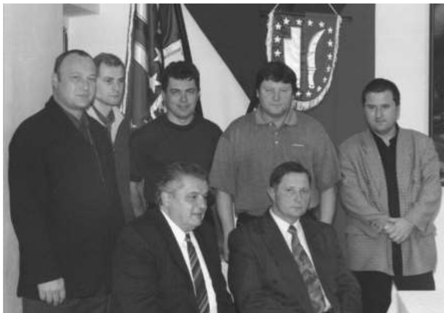
Zastupitelé obce zvolení v roce 2002

Komunální volby do zastupitelstva obce se konaly 1. a 2. listopadu. Kandidátní listiny pro volbu do zastupitelstva se podávaly Městskému úřadu v Kuřimi. Sdružení nezávislých kandidátů muselo svoji kandidátku doložit peticí s podpisy 54 voličů. Zastupitelstvo obce schválilo, že v Moravských Knínicích bude voleno 7 členů zastupitelstva. Pro volby do zastupitelstva obce bylo ve voličských seznamech zapsáno 624 voličů, voleb se zúčastnilo 430 voličů. Do zastupitelstva obce kandidovali a dostali hlasů: Sdružení nezávislých kandidátů za zvelebení a rozvoj obce – získali celkem 2.230 hlasů, tj. 6 mandátů. KDU-ČSL – získali 655 hlasů, tj. 1 mandát.