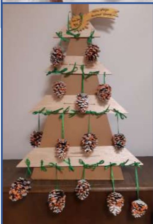
← Obr. 10