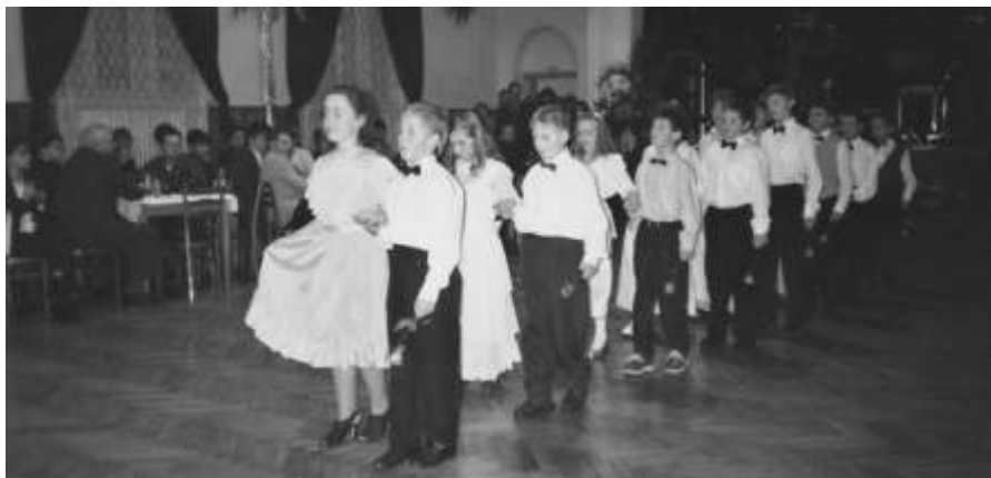
Předtančení na plese – žáci základní školy

Obecní úřad, firma Florcentr a základní škola pořádali 2. února Reprezentační ples. Hrála skupina VELVET z Brna. Výtěžek plesu byl věnován základní škole na zakoupení počítače. Vstupenky byly slosovány v tombole. Ples sponzorovali místní podnikatelé.