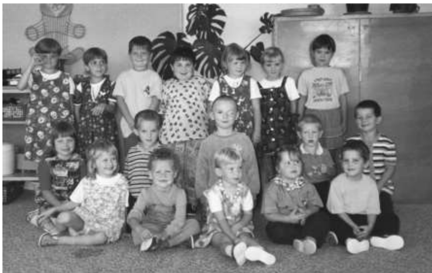
Zahájení školního roku v mateřské škole – září 2002