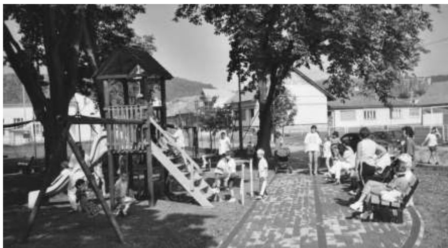
Nové dětské hřiště u sokolovny

Prvního května byl pořádán již XIV. ročník tradičního prvomájového turistického pochodu „Jdeme na chrousty“. Letošní trasa vedla z Knínic podél bývalé německé autostrády do Jinačovic, dále přes Velkou Babu do Medláněk na sportovní letiště, kde byla umožněna prohlídka letadel. Zpáteční cesta vedla s menší změnou přes Babu do Jinačovic a přes Doubravy k myslivecké chatě na Píscích.